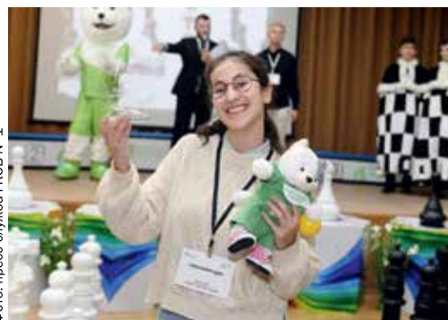
▲ Получать награды всегда приятно