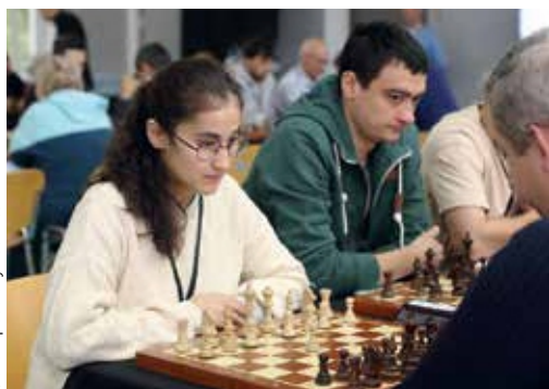
▲ Шахматы – это упражнение для ума